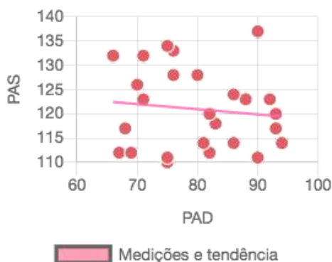
Gráfico de tendência